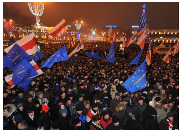
Protestující po vyhlášení výsledků prezidentských voleb 2010

Cena DMS je 30 Kč, na konto sbírky Občanského Bělorusko doputuje 27 Kč.