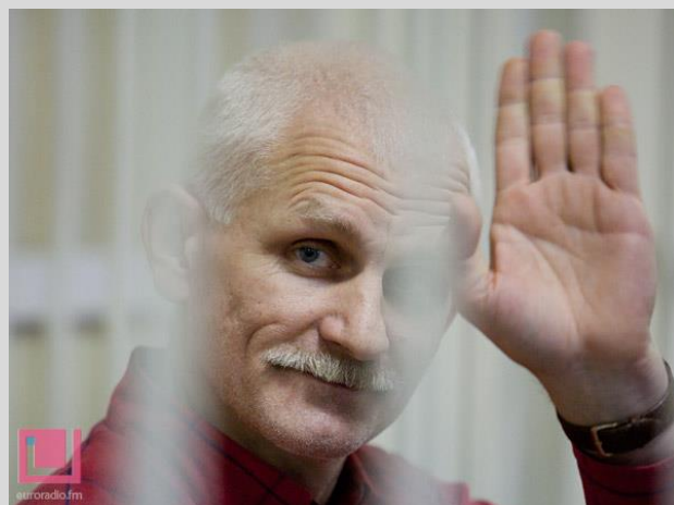
Aleš Bialiacki

Uvěznění známého aktivisty zvedlo vlnu protestů a solidarity. Aleši Bialiackému se dostalo podpory od celé řady významných osobností po celém světě a byl z různých míst navržen na Nobelovu cenu za mír.