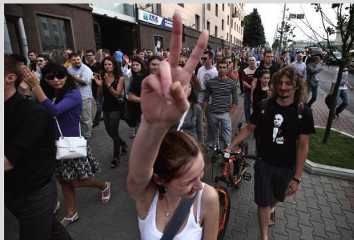
Tiché protesty

Od 15. června do konce července probíhaly v Minsku a dalších běloruských městech tzv. tiché protesty. Cílem těchto protestů, organizovaných přes sociální sítě, bylo vyjádřit protest proti současné situaci v zemi a touhu po zásadní změně. Účastníci protestů chtěli vyjádřit svou nespokojenost se zhoršující se ekonomickou a politickou situací a většinou se jednalo o lidi, kteří dříve nebyli politicky aktivní. Protesty se konaly bez provolávání hesel, bez transparentů a bez politické opozice v čele, lidé se jen shromažďovali na hlavním náměstí a tleskali.